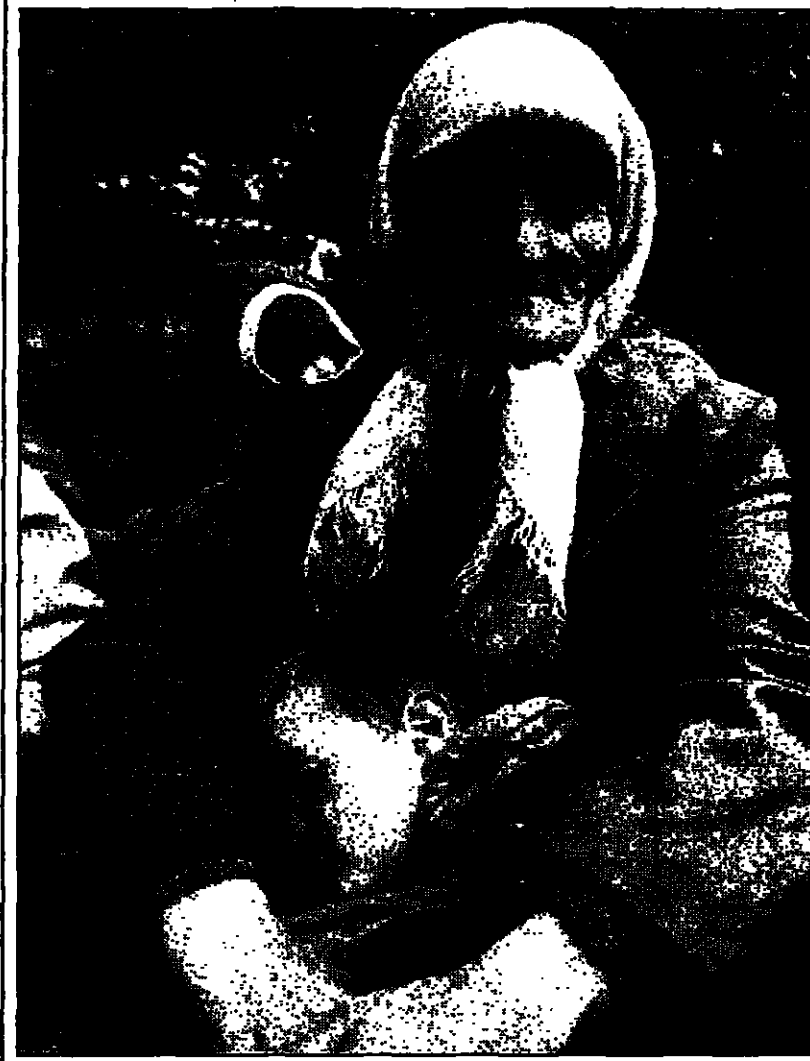
عجز البانوية تحضن اطفالها على متن حاوية تبعتها في فريتها للمرة لاسا

لندن - «القديس العربي»: تحدثت تقارير غربية عن انضمام مقاتلين عرب الى جيش تحرير كوسوفو، محذرة من تأثير ذلك على مساعي التوصل لحل سلمي للصراع في البلقان. وقالت صحيفة «التايمز» البريطانية في عددها الصادر امس ان المقاتلين الاسلاميين عدوا على نشر الفوضى في الحرب في البوسنة والهرسك، حيث اعتبروا هناك من قبل الاجرة الغربية بأنهم مصدر تهديد لقوات حفظ السلام، خاصة الامريكيتين، مشيرة الى ان وصولهم الى كوسوفو قد يبعث بالاشفاق والمخاوف على سياستها في البلقان، وسيخفق جنود الخلافة بين الغرب وجيش تحرير كوسوفو.